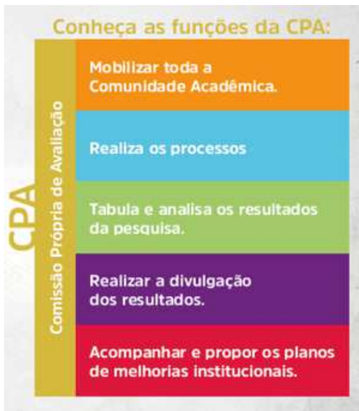
Quadro 3 – Funções CPA