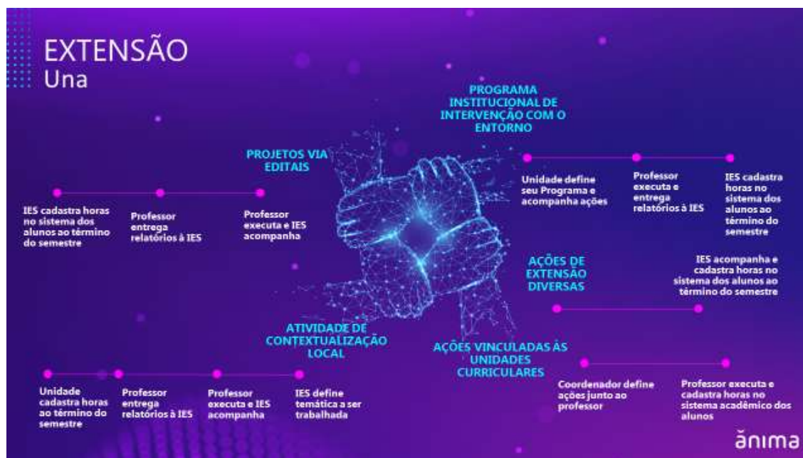
Figura 2: Modalidades de extensão realizadas no UniBH.

A Figura 2 resume as principais modalidades de extensão adotadas pelo UniBH: